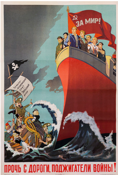
Ил. 1. Брискин В. «Прочь с дороги, поджигатели войны!», 1949.

Важнейшей оппозицией советской пропаганды на протяжении всего периода холодной войны, особенно ярко представленной в плакатном искусстве на этапе второй половины 1940-х — первой половины 1950-х гг., выступала оппозиция «мир vs. война». При этом, как замечает Е. Федосов по результатам анализа 147 плакатов за период 1947–1953 гг., динамика использования понятия «мир» прямым образом сочетается с внешнеполитическими событиями, чаще всего оно появляется в плакатах 1950 и 1953 гг. [Федосов, с. 152]. Репрезентация «своих» и «чужих» в большинстве случаев осуществлялась за счет приема противопоставления, призванного подчеркнуть дихотомию образов. Антиамериканские плакаты позднесталинской эпохи, особенно те, которые были задуманы в формате «мы — они», возродили и подчеркнули глубоко укоренившуюся биполярную концепцию