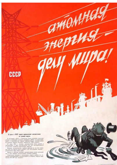
Ил. 3. Бриссин В., Иванов К. «Атомная энергия - дело мира!», 1954.

После Карибского кризиса, поставившего мир на грань глобальной ядерной катастрофы, антивоенные лозунги в советском политическом плакате зазвучали с новой силой. Несмотря на разрядку международной напряженности, подписание договора об ограничении стратегических вооружений (ОСВ-1) и договора по ограничению систем противоракетной