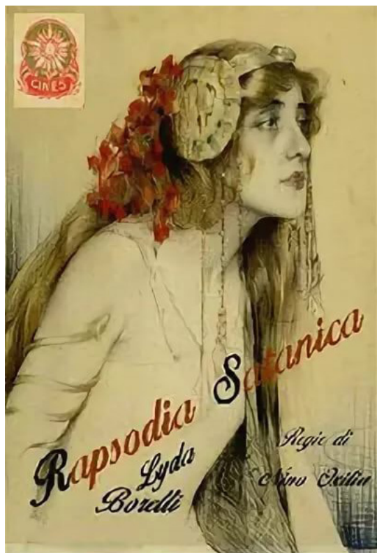
Плакат к/ф «Rapsodia satanica» (1917)

Фильм сохранился с небольшим сокращением (850 м / 45 мин / цветной). 1917 : комедия «Жены и апельсины» («Le mogli e le arance»), 1919 м / 74 мин., пр-во «Do. Re. Mi.»; продюсер и автор сюжета Лучио Д'Амбра